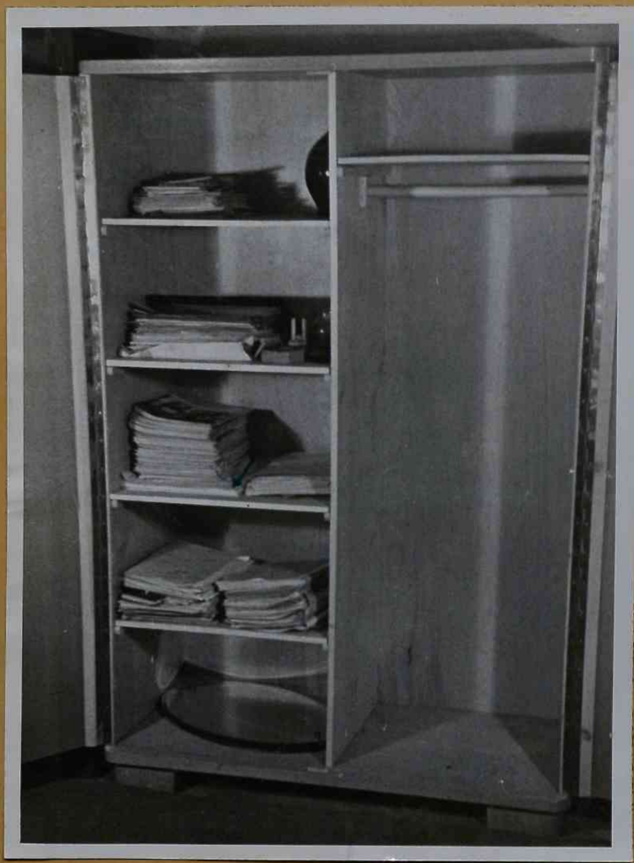
Označení, kde zprávy byly ukryty.